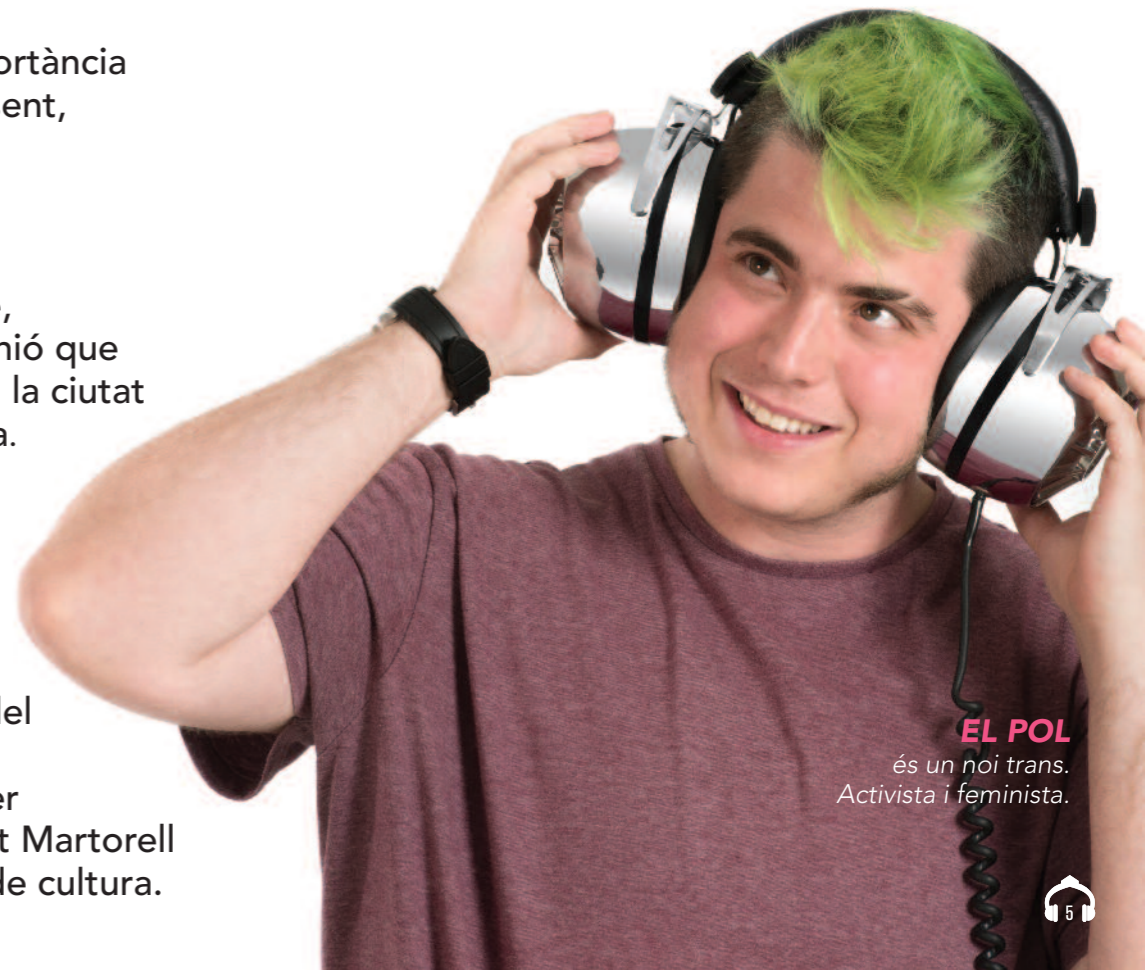
EL POL és un noi trans. Activista i feminista.

El Pont a les Arts Sonores esdevé una aposta ferma per la música i a la riquesa del nostre patrimoni. El PAS torna i creix per quedar-se, identificant Martorell com a ciutat motora de cultura.