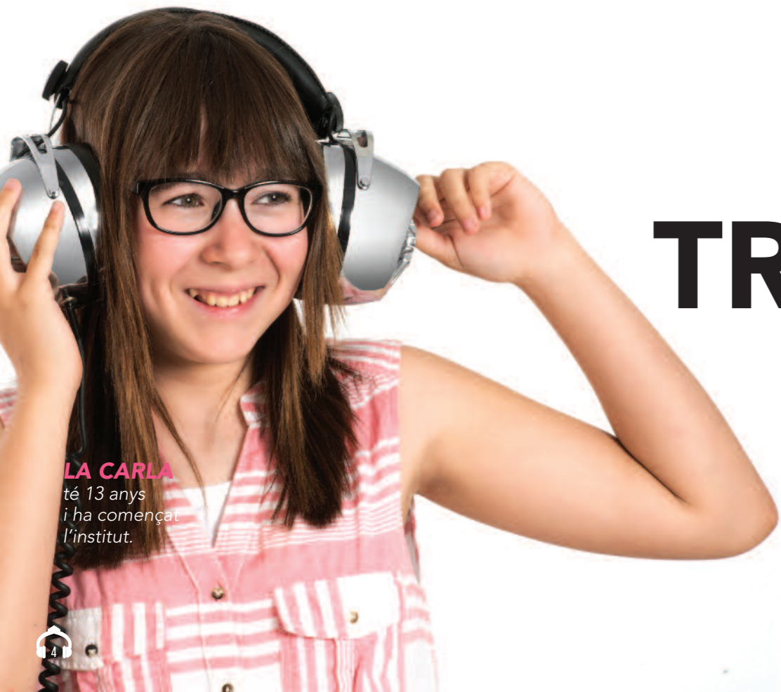
LA CARLA té 13 anys i ha començat l'institut.